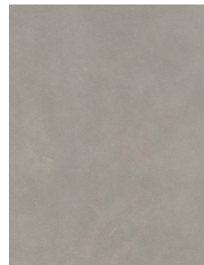
TOUCH LIGHT GREY