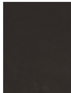
TOUCH TESTA DI MORO