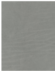
TOUCH AQUA MARINE