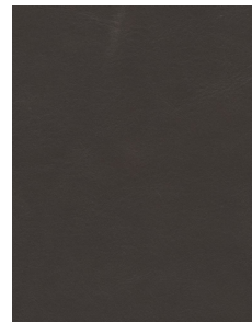
HIPPO MOON MIST