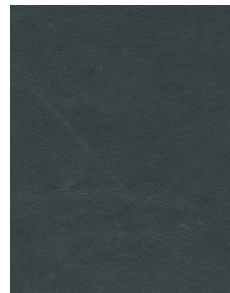
GLAMOUR LEAF GREEN