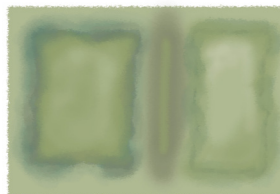
carpet gradient moss the ratio will always be 2:3