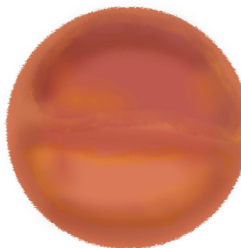
carpet gradient gravel can be ordered in circle size up to Ø 400cm