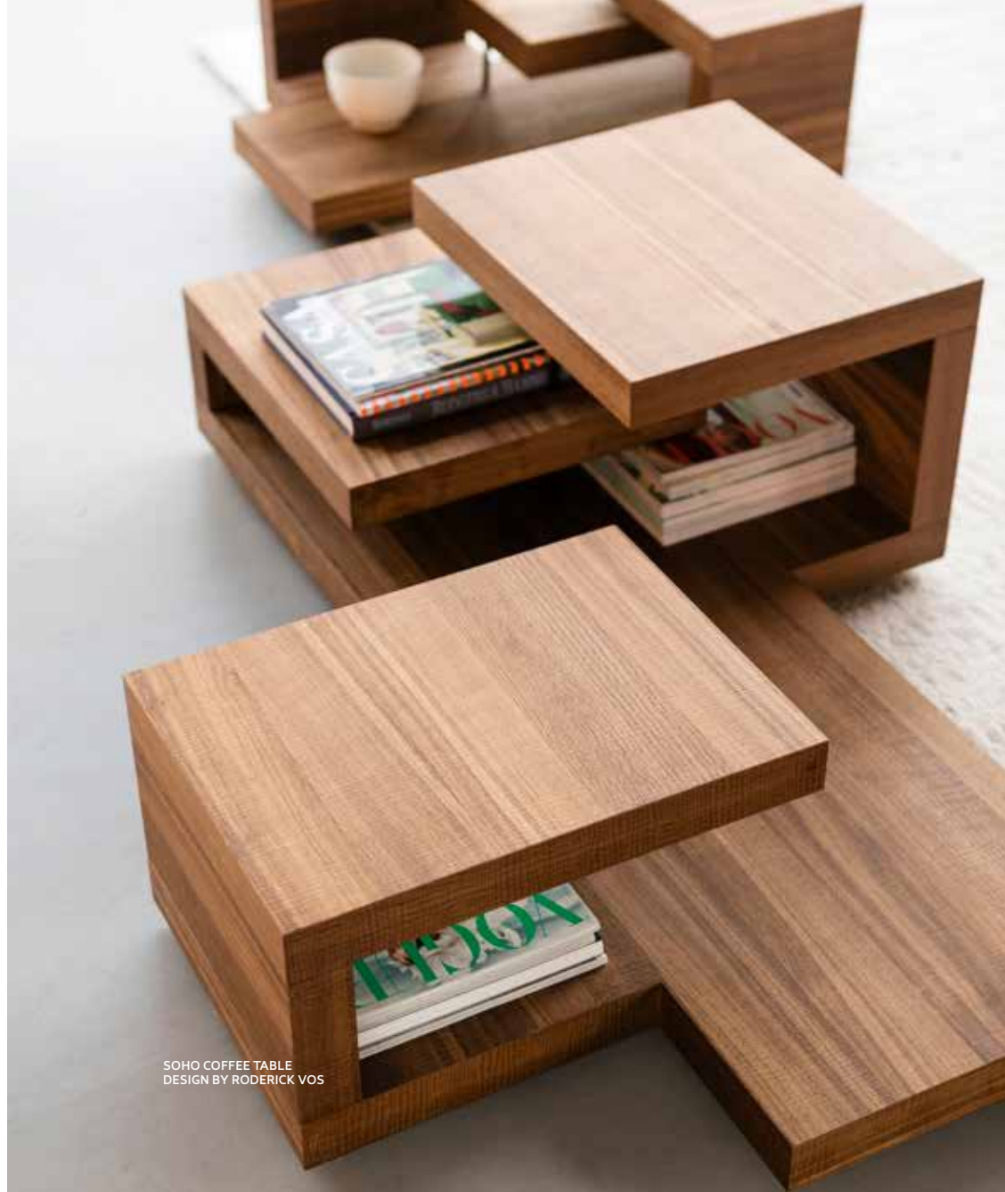
SOHO COFFEE TABLE DESIGN BY RODERICK VOS