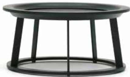
OBI COFFEE TABLES DESIGN BY RODERICK VOS