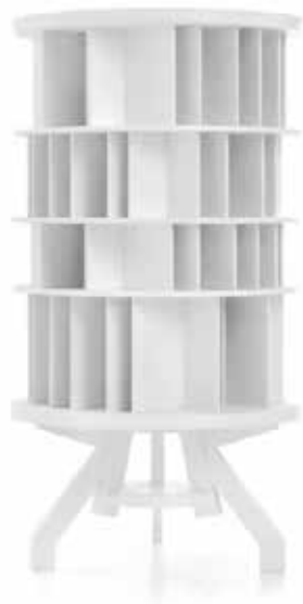
NUREYEV BOOKCASE DESIGN BY RODERICK VOS

De collectie van Linteloo straalt 'leefluxé' uit en is ontworpen om te gebruiken. Wij verstaan de kunst van de perfecte imperfectie; gebruikssporen en oneffenheden geven het product karakter. Ze benadrukken de duurzame en ambachtelijke manier waarop het product is gemaakt.