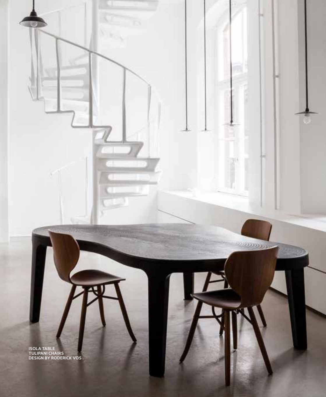
ISOLA TABLE TULIPANI CHAIRS DESIGN BY RODERICK VOS