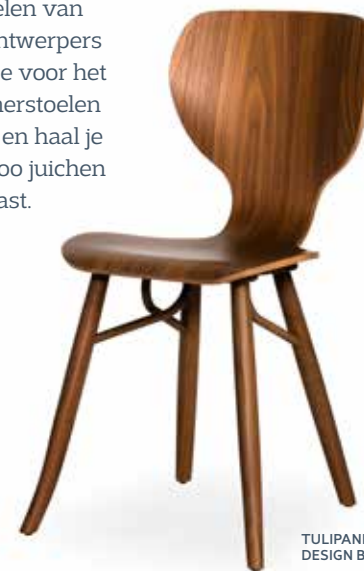
TULIPANI CHAIR DESIGN BY RODERICK VOS

Met de passie voor het leven en het delen van happiness hebben wij samen met de ontwerpers onze eettafel collectie neergezet. Kies je voor het comfort van zacht gestoffeerde eetkamerstoelen of ga je voor een eigenzinnig ontwerp en haal je nieuwe energie in huis? Binnen Linteloo juichen we beide toe; zolang het maar bij jou past.