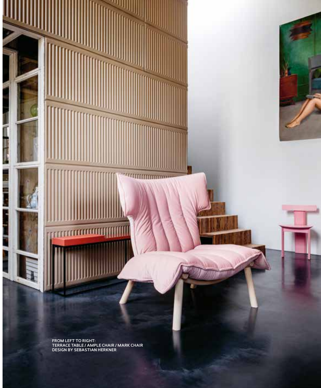
FROM LEFT TO RIGHT: TERRACE TABLE / AMPLE CHAIR / MARK CHAIR DESIGN BY SEBASTIAN HERKNER